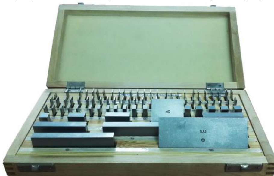
Рисунок 1 - Общий вид набора мер длины концевых плоскопараллельных